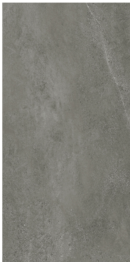
30 x 60 cm (12" x 24") fini mat HV.CS.SMK.1224.MT

Tous les items présentés dans ce document font partie du programme d'inventaire Olympia. Pour les commandes spéciales, veuillez contacter votre représentant de Tuiles Olympia.