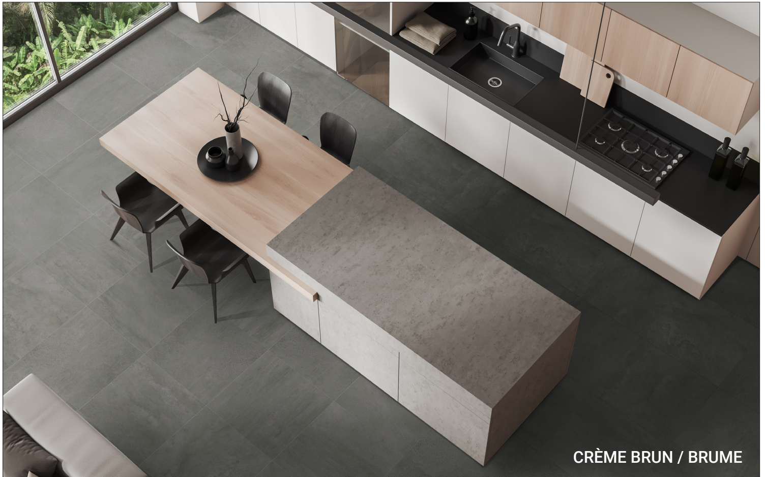
CRÈME BRUN / BRUME