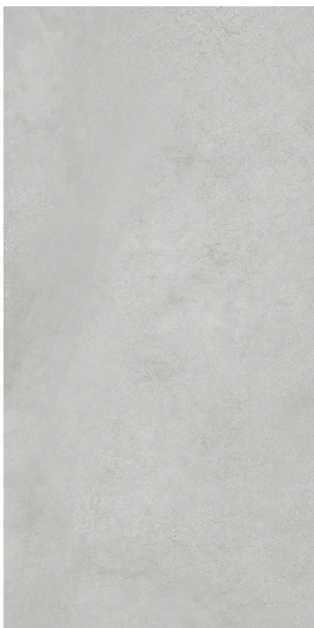
30 x 60 cm (12" x 24") fini mat HV.CS.OWT.1224.MT